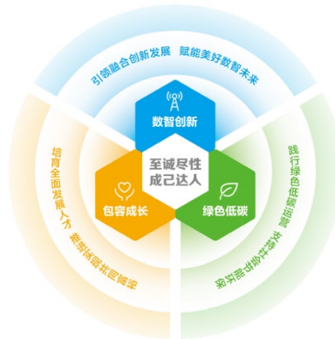
中国移动可持续发展模型

履责理念 即“至诚尽性、成己达人”，即“以天下之至诚而尽己之性、尽人之性、尽物之性（至诚尽性），在实现企业自身可持续发展的基础上（成己），积极发挥所长，为经济、社会、环境可持续发展作出贡献（达人）”。