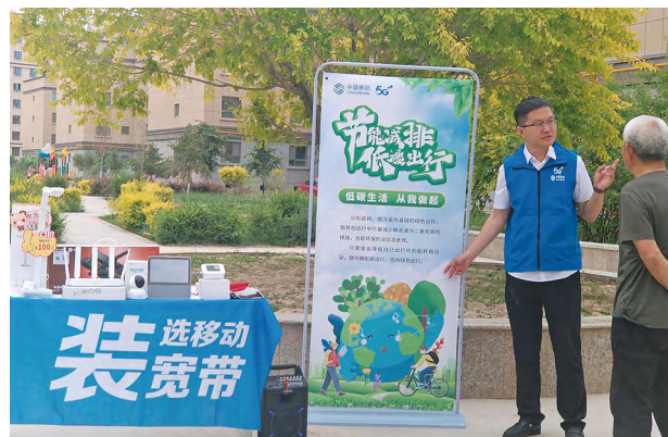
中国移动以多种形式向社区居民宣传绿色低碳节能知识

中国移动积极带动社会同创共建绿色生活，推动数字生活与绿色生活的融合共生。公司多重形式开展系列绿色环保主题公益活动，并连续第 16 年开展“节能宣传周”活动。2024 年，活动面向 45 万员工和超 9 亿客户普及绿色低碳发展理念，向全社会普及节能低碳知识，推动公众生活方式绿色化理念深入人心，携手全民生活方式向绿色低碳转型。