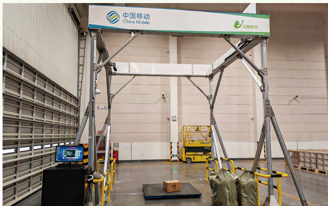
绿色供应链—称重量方一体机（货物规格自动采集）

构建绿色仓库评价指标体系，积极发展智慧仓储，提高仓储环节能源利用效率，降低碳排放，贯通“入库-拣配-出库”全流程，深度融合清洁能源、AI、5G-A 等多项技术，实现设备低碳化、作业自动化，通过引入电动叉车、称重量方一体机等设备，入库效率提升 90%，物流成本节省 75 万元/年。公司已建立 7 个星级绿色仓库，17 个仓库被评为绿色仓库。