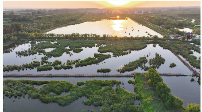
黄河生态环境保护

黄河新乡段滩区面积大，曾存在诸多破坏生态的建筑与养殖场。2023 年 4 月起，中国移动与新乡国家级自然保护区综合服务中心合作，运用 5G、大数据和 AI 边缘计算等技术打造一体化解决方案，对黄河湿地乱占乱建行为进行全天候高清监控，监管效率提升 70%。在防火方面，基于智慧管理平台，凭借 5G 特性与 AI 算法，可对保护区火灾全天候监测预警、智能决策，监测点内发现疑似火情能自动报警并生成信息，还构建了巡护信息化管理平台。在鸟类监测上，利用 5G+AI、红外感应等方式结合环境数据，对 370 余种鸟类 AI 建模，实时监测其种类、状态和分布，准确率达 94%。中国移动通过加强 5G 与新业态、新技术深度融合，助力黄河流域水域治理，努力实现河湖安澜、山清水秀。