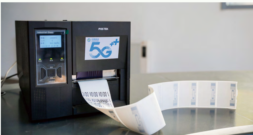
打印无源物联标签

中国移动在山东携手德州供电公司，以德州检储配基地为试点，打造无源物联试点，创新搭建组网式无源物联系统，打造“全量赋码+无源物联”仓储管理新模式，落地建成“一键盘点”“自动出入库”等便捷应用，大幅提高物资管理效率，降低仓储运营成本。“中移载物”物资管理平台，提供资产盘存、定位、出入库管理，对接现有业务系统，实现全方位运维管理；物资出入库时，无源物联设备自动校验读取物资标签信息，对比传统人工