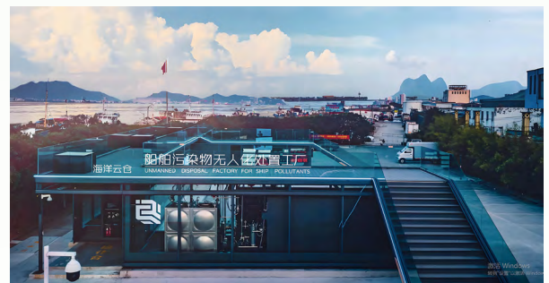
船舶水污染防治海洋云仓系统

中国移动积极响应生态环境部《全国海洋生态环境保护“十四五”规划》，在台州市实施“海洋蓝色循环”项目，积极探索海洋污染物治理新模式。通过融合新质算力优势技术，借助先进的算法和数据分析技术，云仓自动识别污染源、预测污染趋势，形成海洋垃圾收集、运输、再生、高值利用的可循环价值链，有效解决海洋垃圾无人收、价值低、可持续的问题；同时扩展新质算力优势效能，助推蓝色经济模式发展，为区域海洋蓝色经济循环发展和提高当地渔民及渔业产业经济效益做出贡献。该项目为助力海洋生态治理转型提供了重要借鉴，荣获联合国“地球卫士奖”。