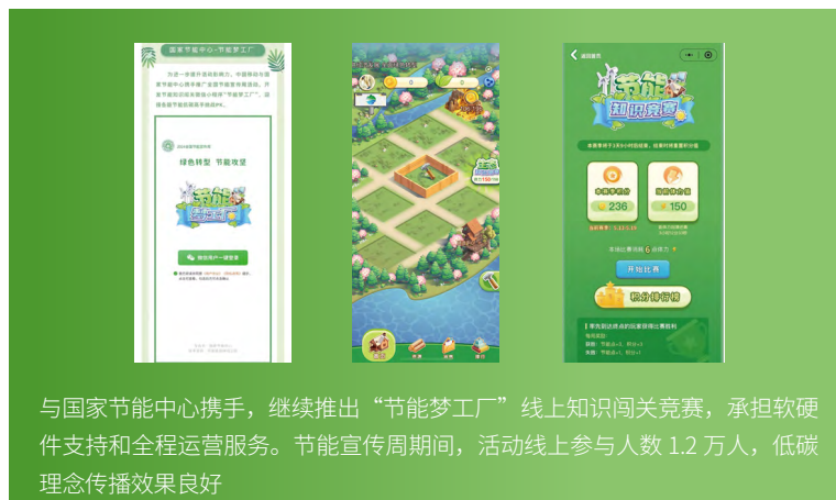
与国家节能中心携手，继续推出“节能梦工厂”线上知识闯关竞赛，承担软硬件支持和全程运营服务。节能宣传周期间，活动线上参与人数 1.2 万人，低碳理念传播效果良好