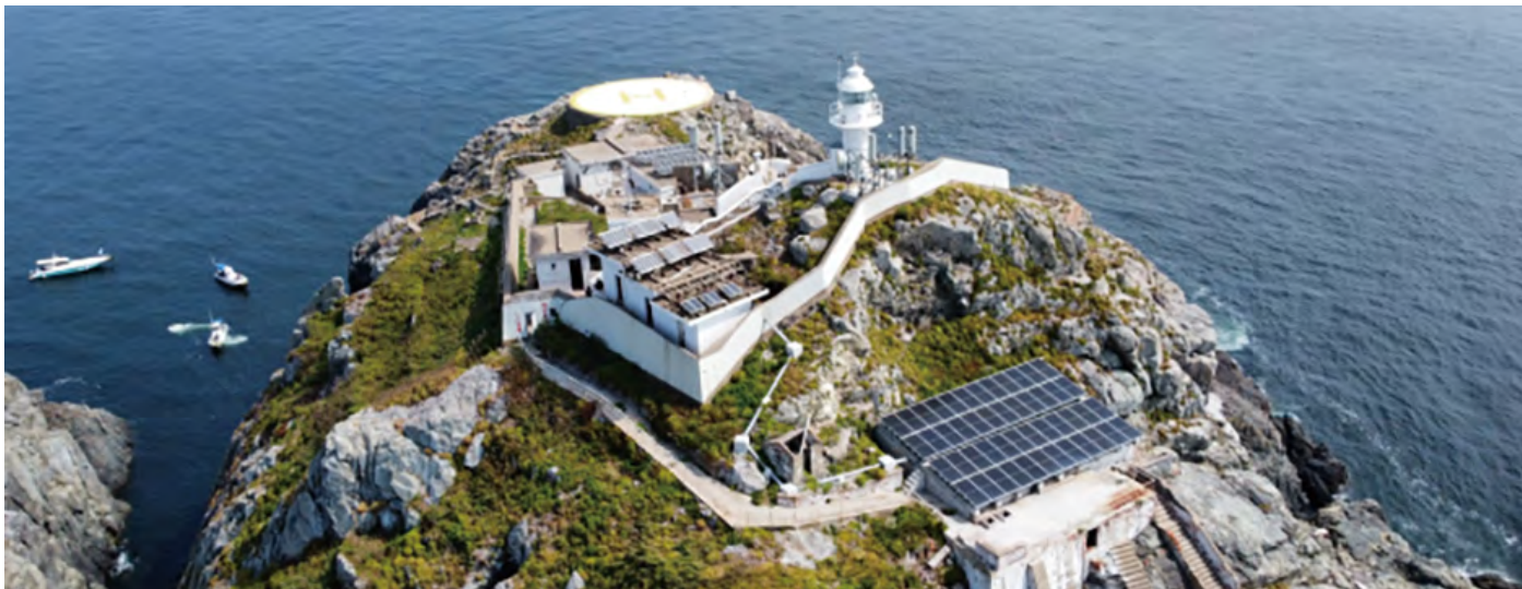
中国移动在舟山架设的零碳基站